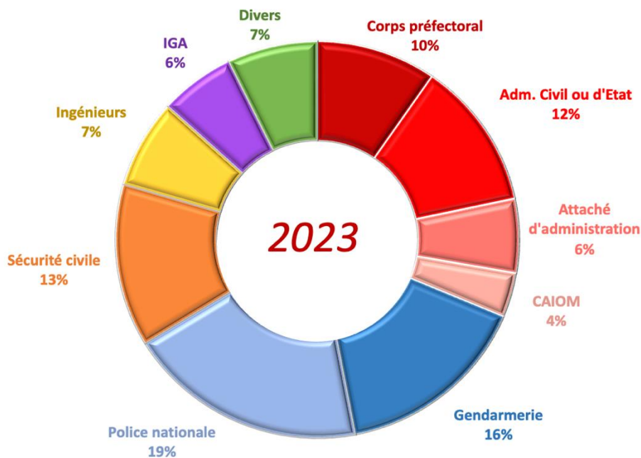
UNIVERS PROFESSIONNEL DE NOS ADHÉRENTES AU 31/12/2023

Les adhérentes de l'association Femmes de l'Intérieur représentent tous les univers professionnels du ministère et une grande diversité d'affectations territoriales.