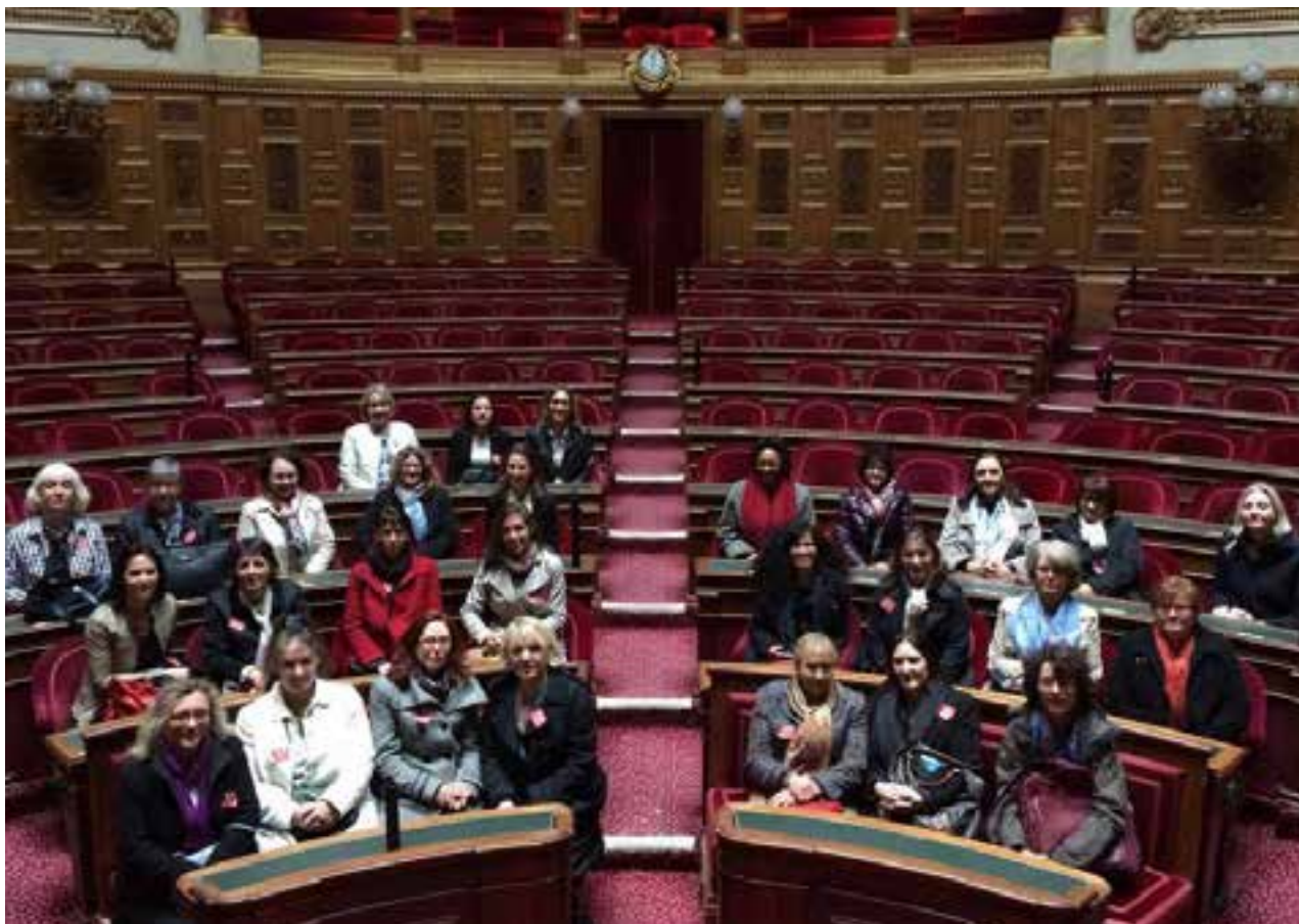
Visite guidée au Sénat – 19 avril 2017

Cette visite du Palais du Luxembourg a permis de découvrir un patrimoine d'une grande richesse du siège d'une des principales institutions françaises. Notre guide nous a accueilli au pied de l'escalier d'honneur, fait découvrir la galerie des bustes, la salle de lecture de la bibliothèque, l'annexe de la bibliothèque, le salon des messagers d'État, la salle des conférences et, naturellement l'hémicycle (photo). Puis nous nous sommes rendues au rez-de-chaussée pour visiter la salle du livre d'ornée de lambris dorés de tapisseries aux couleurs dominantes d'or et d'azur ; les