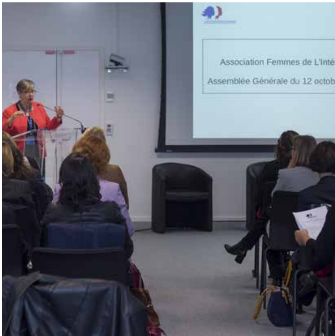
Assemblée générale – 12 octobre 2017