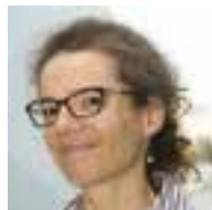
Cécile Dimier CAIOM Cheffe du bureau des établissements de jeux, Direction des libertés publiques et des affaires juridiques